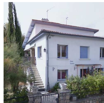
La villa Marie-Galante à St Péray