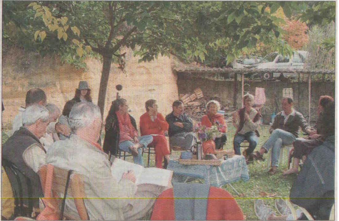
Vivre une expérience communautaire.

Certains des habitants pourront proposer aux autres mais aussi aux personnes de l'extérieur des activités communes, qï gong, chant prénatal, jardinage et cuisine bio, massage, peinture, clown par exemple. Egalement il est envisagé des activités économiques utiles à la fois au groupe et à la commune, également portées par de futurs habitants : ateliers d'artistes, accueil de stages d'épanouis-